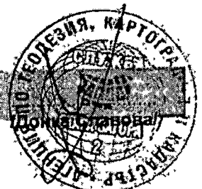
Схема № 15-164943-19.02.2024 г. издадена въз основа на заявление с входящ № 01-63967-05.02.2024 г.

Акт за частна държавна собственост № 194 том 1 рег. 335 дело 210 от 23.03.2010 г., издаден от Служба по вписванията гр. Смолян